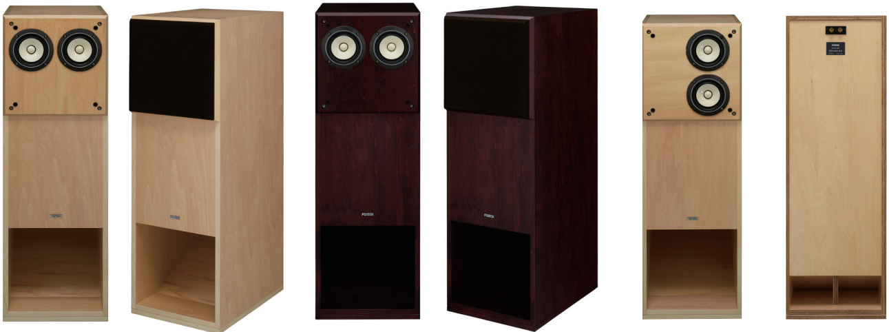
BK1082-Sol (CL) (FE108-Sol 装着時 / 2台)