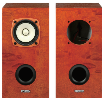
YK83-Sol(2台)／FE83-Sol(左側に装着) ※YK83-SolにFE83-Solは含まれません

入力端子はファストン 205 タイプの低損失金メッキ端子を採用。スピーカーケーブルの確実な接合と音質劣化を防ぎます。