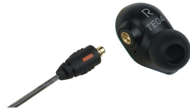
着脱式ケーブルを採用