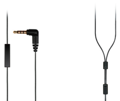
インライン・コントローラー付きケーブル