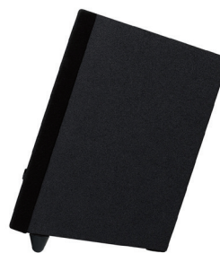
角度調整用ゴム足を付属