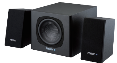
◎組み合わせ例 サブウーハーPM-SUBmini2(別売)+PM0.1e