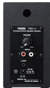
裏面(右側:アクティブ側)