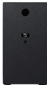
裏面(左側:パッシブ側)