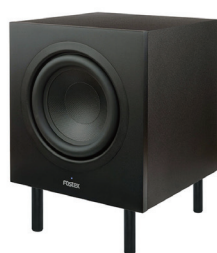
※サブウーハーPM-SUB8(別売)組み合わせ例

サブウーハー PM-SUB8 に最適なスピーカー・テーブル。キャビネットの振動を最適化し、ダイナミックレンジがアップ。