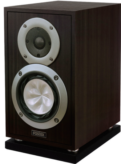
<GX100BJ(別売)を載せた使用例>

スピーカーシステムを置くときに底面全体が面で接すると、底面の響きが抑えられてしまい下方向の音場感が損なわれる事があります。SB100は、上面の四隅に配したアルミとEVAスポンジの複合構造のフットによってスピーカーシステムを浮遊させたように、底面の響きを抑えずに設置することができ、また、底面も全面EVAスポンジ仕上げで、設置時のガタつきを防ぎ、スピーカーシステムの振動を遮断するので、置き場所の影響を受けにくく、より自然な音場再生が可能となります。