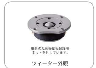
撮影のため振動板保護用 ネットを外しています。