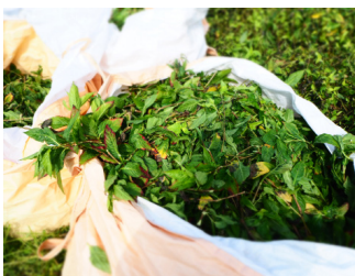
4. 色素を抽出する葉