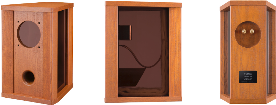
※FE103Aの装着イメージです。